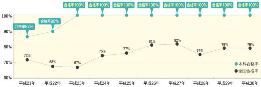
図1 臨床検査技術学科